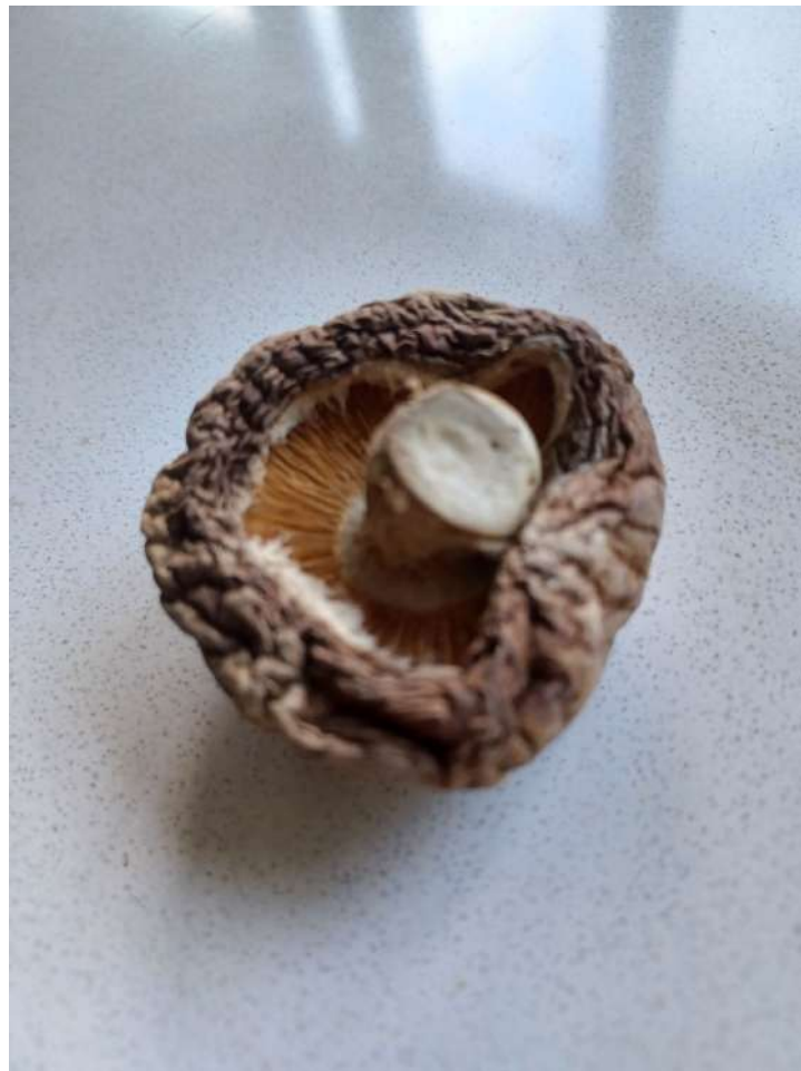
Imagen del modelo propuesto:

Trabajar siempre a una escala MAYOR que la del modelo propuesto