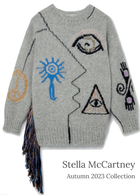
Stella McCartney Autumn 2023 Collection